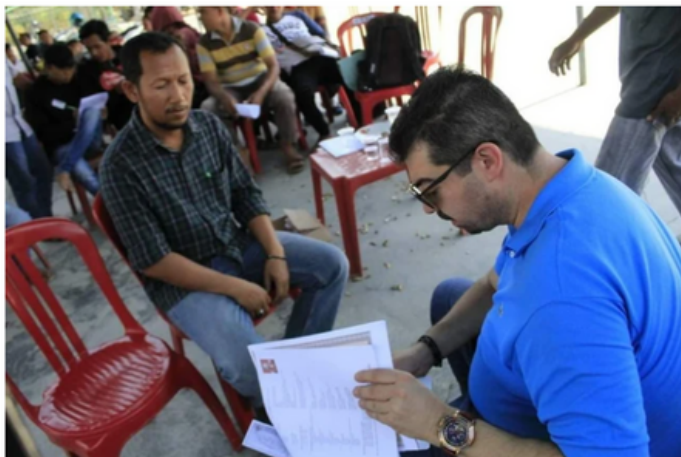
Muncitori din Indonezia sunt intervievați de reprezentanții Work from Asia

Sute de muncitori din Indonezia sunt intervievați de reprezentanții agenției de reclutare de personal străin Work from Asia pentru a obține un loc de muncă în România.